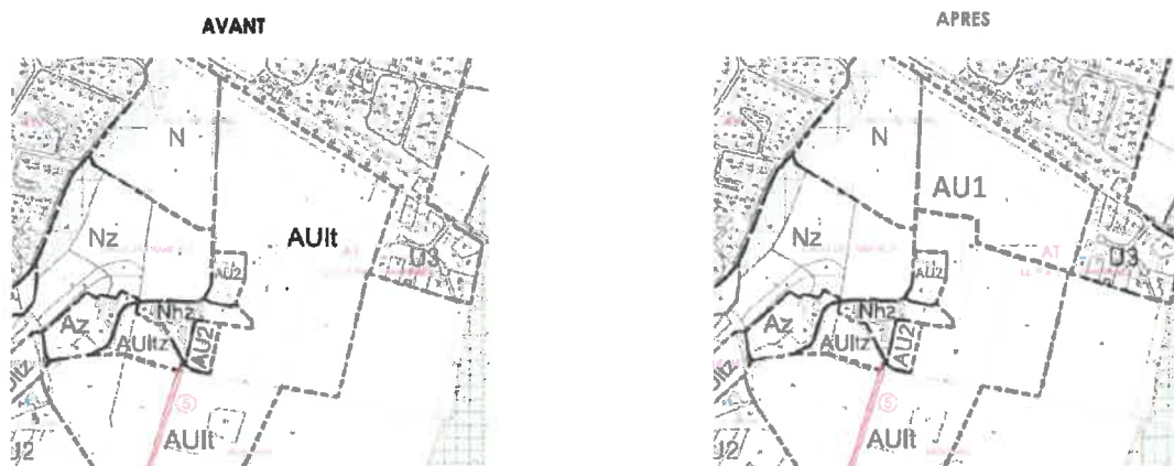
Schéma d'aménagement :

Une partie de la zone AUI1 est reclassée en zone AU1, zone d'urbanisation future, à vocation d'habitat et de services, où une certaine densité est recherchée. L'autre partie de la zone reste classée en AUI1.